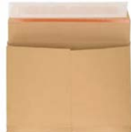
Envelobox bruin (38 x 26 x 3 cm)