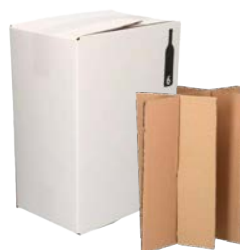
Verzenddoos voor 6 flessen – Staand