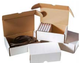
Witte stansdoos (A4+)