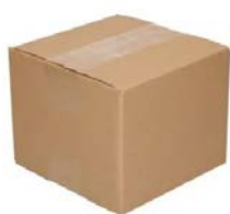
Enkelgolf verzendoos (15 x 15 x 12 cm)