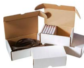
Witte stansdoos (A5)