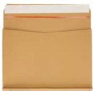
Envelobox bruin (25,5 x 18,5 x 3,0 cm)

De envelobox is een combinatie van een verzendzak en brievenbusdoos en handig voor het inpakken van kleine items, zoals boeken of gadgets. De onderkant van de envelobox kun je uitvouwen, waardoor deze zich aanpast aan het formaat van jouw producten. De envelobox is voorzien van een plakstrip, waardoor je deze eenvoudig kunt sluiten. De envelobox is gemaakt van 450 grams massief karton.