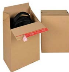
Autolock verzenddoos (29,4 x 19,4 x 38,7 cm)