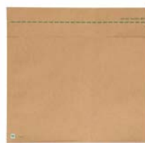
Verzendzak S (30 x 37 cm)