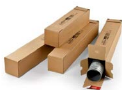
Vierkante koker (61 x 10,8 x 10,8 cm)