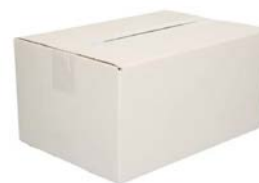
Enkelgolf verzendoos (30,5 x 21,5 x 15 cm)