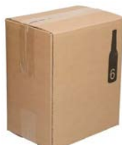
Verzenddoos voor 12 bierflessen