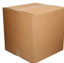
Dubbelgolf verzendoos (40 x 40 x 40 cm)