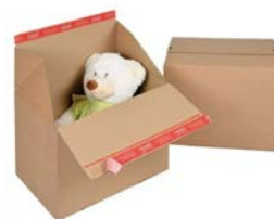
Autolock verzenddoos (39,4 x 29,4 x 28,7 cm)