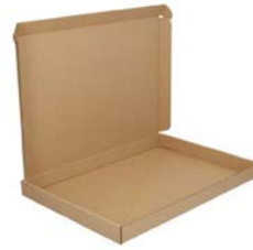
Bruine brievenbusdoos (met bovenklep) A4+