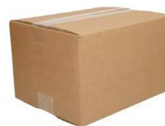
Dubbelgolf verzendoos (59,1 x 39,1 x 28 cm)