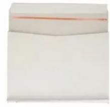
Envelobox Wit (35 x 25 x 3 cm)