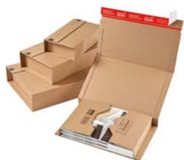
Boekverpakking (14,7 x 12,6 x 5,5 cm)