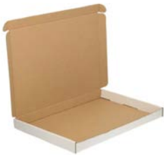
Witte brievenbusdoos (met bovenklep) A4+