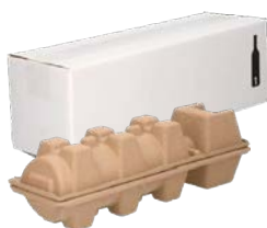
Verzenddoos voor 1 wijnfles – liggend

In onze webshop kun je kiezen uit verschillende flesverpakkingen. Zo kun je kiezen uit een luxe wijnkist - gemaakt van hout - of een verzenddoos voor één of meerdere wijn- of bierflessen. Alle flesverpakkingen zijn voorzien van een handig interieur om jouw flessen te beschermen. De doos is gemaakt van EB-golf karton en heeft een dikte van \pm 4,5 mm.