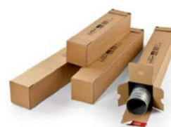
Vierkante koker (86 x 10,8 x 10,8 cm)