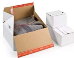
Autolock retourdoos (38,9 x 32,4 x 16 cm)