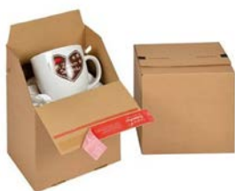
Autolock verzenddoos (19,5 x 14,5 x 19 cm)