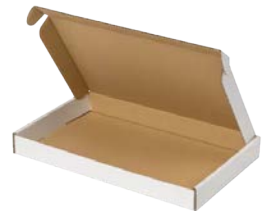
Witte brievenbusdoos (met bovenklep) A5+