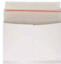
Envelobox wit (38 x 26 x 3 cm)