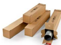
Vierkante koker (70,5 x 10,8 x 10,8 cm)