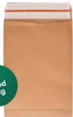
Do Good Bag S (30 x 20 x 5 cm)

Een verzendzak is ideaal voor het versturen van kleding. De verpakking is beschikbaar in meerdere formaten en bevat een handige plakstrip, waardoor je een bestelling snel kunt inpakken. Mocht jouw klant de bestelling willen retourneren, dan kan dit eenvoudig met behulp van de tweede beschikbare plakstrip. De verzendzak - ook wel Do Good Bag genoemd - is ideaal voor het compact verpakken van jouw producten en gemaakt van gerecycled kraftpapier. Dit maakt deze verpakking een duurzame keuze.