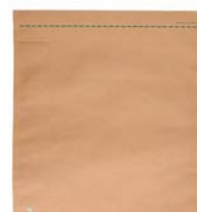
Verzendzak M (34 x 42 cm)