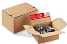
Autolock verzenddoos (21,3 x 15,3 x 10,9 cm)