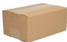
Enkelgolf verzendoos (16,5 x 15 x 13 cm)