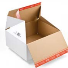
Autolock retourdoos (38,9 x 32,4 x 32 cm)